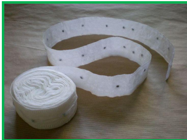
Ruban de semences commercial

Beaucoup de jardiniers trouvent les rubans de semences (rubans porte-graines) pratiques. Il s'agit d'un ruban de papier biodégradable mince sur lequel sont collés des semences du légume ou de la fleur à semer, déjà à l'espacement requis pour le développement futur de la plante.